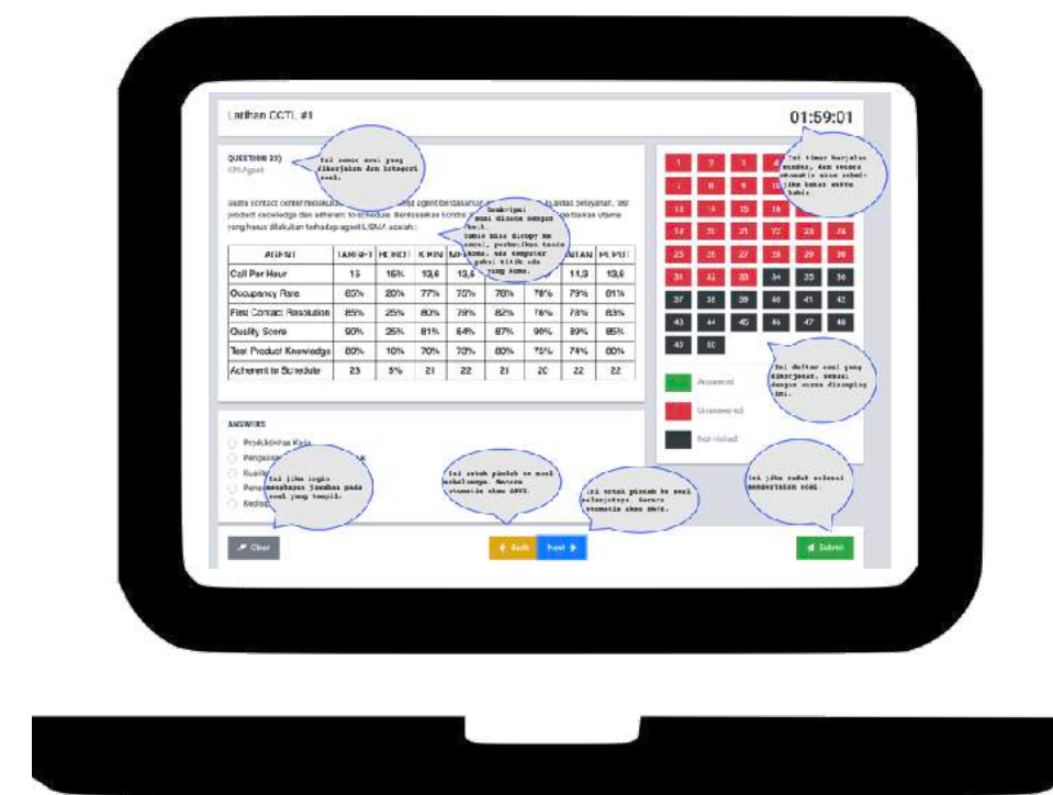
Quiz Online Soal Sequence 1 - 50