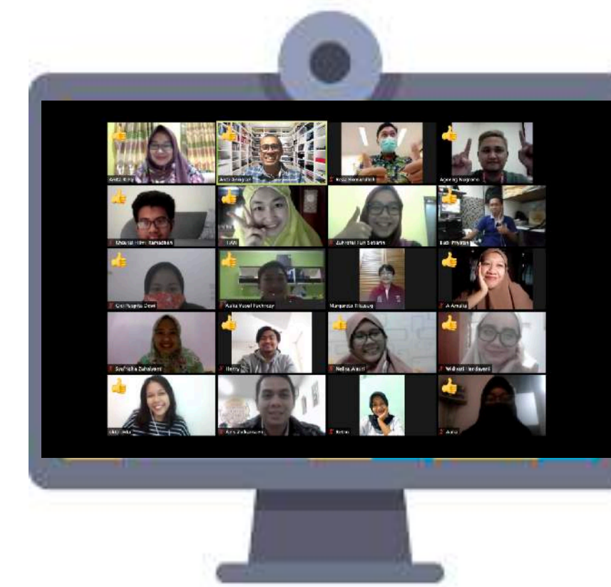
Pengawasan ZOOM video conference